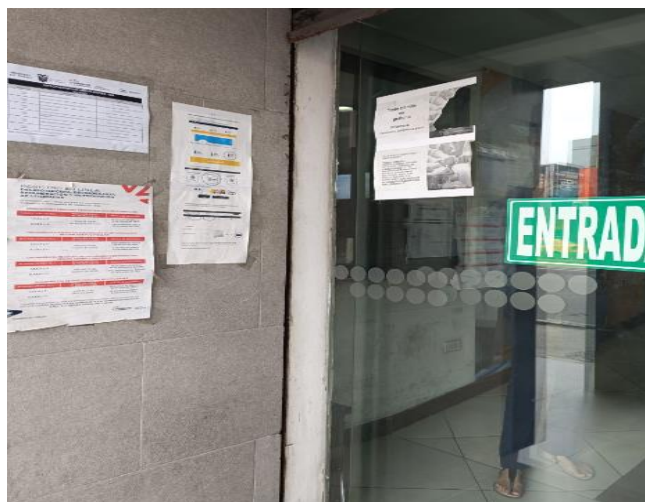
Planta Baja (Entrada de los elevadores ubicados lado izquierdo)