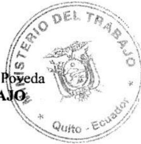
Abg. Andrés Vicente Madero Poveda MINISTRO DEL TRABAJO

A handwritten signature in black ink, appearing to read 'Andrés Vicente Madero Poveda'.